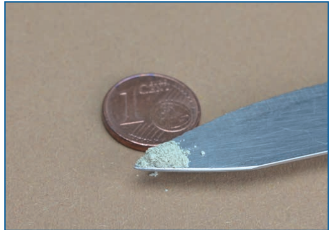
Abb. 1: Eine wirklich kleine Messerspitze für ein 30 ml Fläschchen – bitte nicht mehr verwenden.

Wenn Sie das Pulver in Wasser auflösen um es zu versprühen, achten sie bitte unbedingt auf die richtige Dosierung. Hierdurch vermeiden Sie, daß das extrem feine Pulver bereits im Kugelsprühkopf die ihm zuge dachte Wirkung entfaltet und den Sprühkopf zusetzt. In das von uns angebotene 30 ml Fläschchen, das Sie vielleicht mitbestellt haben, geben Sie bitte nicht mehr als eine wirklich kleine Messerspitze des Seelenstark plus Pulvers (siehe Abb. 1). Nur dann kann der Sprühkopf seiner Aufgabe ohne Probleme nachgehen und einen feinen Nebel versprühen ohne sich zuzusetzen. Verwenden Sie ein größeres Sprühfläschchen, passen Sie die Menge entsprechend an.