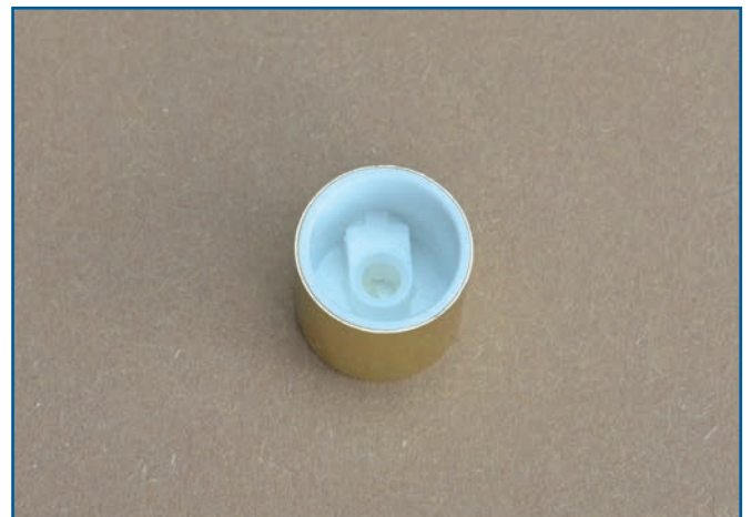
Abb. 4: umgedrehter Sprühkopf